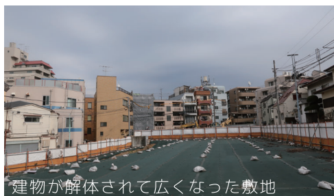
建物が解体されて広がった敷地